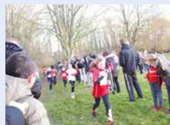
> Le parc sportif avant le confinement avec des enfants des écoles solidaires...