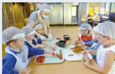
> À Douchy, le choix de maintenir les activités de loisirs durant les deux mois d'été a été fait en responsabilité...